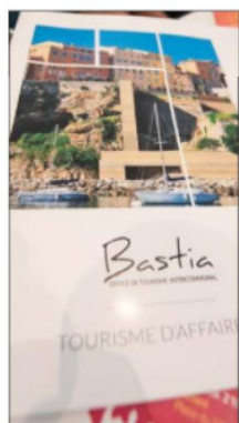
C'est dans les locaux d'Avvià que s'est tenue la conférence de presse. ANGELE CHAVAZAS