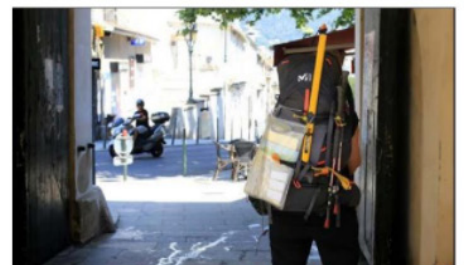
La tendance de la fréquentation touristique pour l'été est dans le vert. XAVIER GRIMALDI

Une richesse pour les animations qui trouvera forcément son public, d'autant que les tendances pour la fréquentation sont toutes dans le vert. Un touriste ne pourra plus dire qu'il n'y a rien à faire sur le territoire de l'agglomération. Y.M.