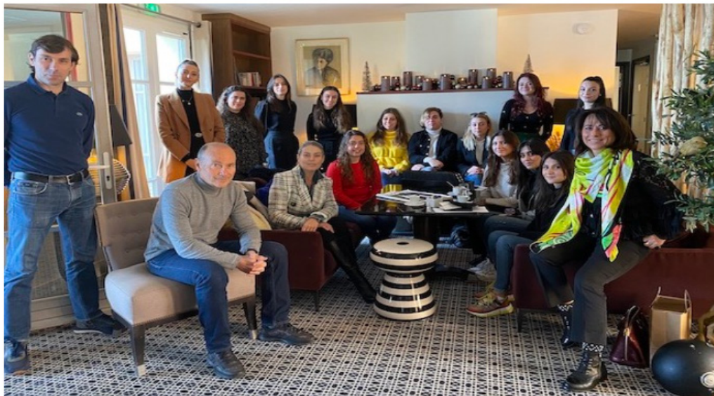
L'Hôtel des Gouverneurs accueillait les étudiants de l'IAE tourisme pour échanger avec eux sur les nouvelles pratiques du secteur

Ainsi, les étudiants de l'IAE qui se trouvaient il y a quelques semaines à Porto-Vecchio pour parler de tourisme durable, seront amenés après ce séjour bastiais à se rendre dans d'autres séminaires à Ajaccio, Bonifacio et en Balagne, trois régions où l'activité touristique est la plus marquée.